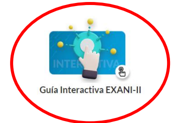
Guía Interactiva EXANI-II