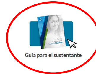
Guía para el sustentante